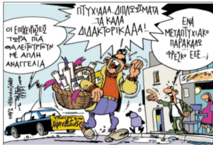
Του ΓΙΑΝΝΗ ΚΑΜΑΪΤΖΗ

Δεν ξέρουμε πως την έχουν δει έτσι οι συνάδελφοι φυσικοί της Ένωσης. Αυτό που ξέρουμε, γιατί το βλέπουμε, είναι ότι «ξεκολώθηκαν», μετά συγχωρήσεως, ιδιαίτερα τα δύο τελευταία χρόνια στη διοργάνωση τέτοιων σεμιναρίων (επ' αμοιβή βεβαίως-βεβαίως), μια με το Χαροκόπειο, την άλλη με το Καποδιστριακό, την παρ' άλλη με το Μακεδονίας και πάει λέγοντας. Όλα γύρω απ' την