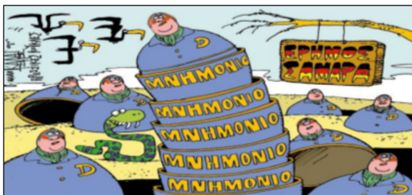
Του ΓΙΑΝΝΗ ΚΑΛΑΪΤΖΗ